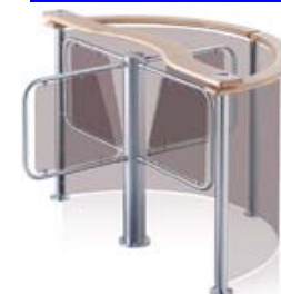
Турникет PERCo-RTD-03S с формирователем PERCo-RB-03TP