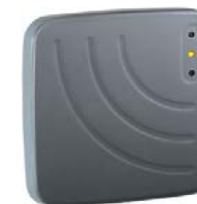
Считыватель дальнего действия PERCo-IR10