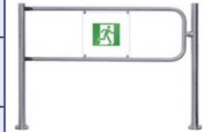
Поворотная секция ограждения серии PERCo-BH02 с электро-магнитным устройством блокировки