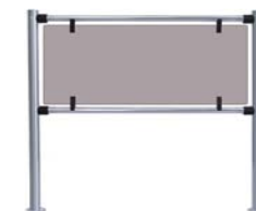
Стационарная секция ограждения серии PERCo-BH02 с заполнением