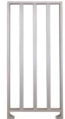
Секция полноростового ограждения серии PERCo-MB-15