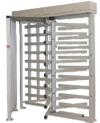
Полноростовый роторный турникет PERCo-RTD-15R