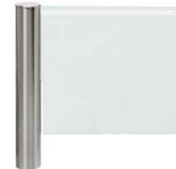
PERCo-WMD-06 с преграждающей створкой