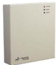
Контроллер замка/турникета PERCo-CT/L04