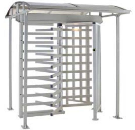
Полноростовый роторный турникет PERCo-RTD-15R с крышей PERCo-RTC-15R