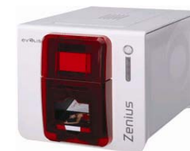
Принтер Evolis Zenius USB