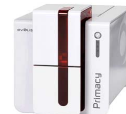
Принтер Evolis Primacy, USB & Ethernet