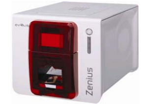
Принтер Evolis Zenius USB