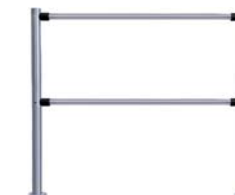
Стационарная секция ограждения серии PERCo-BH02 без заполнения