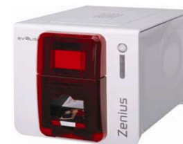
Принтер Evolis Zenius USB