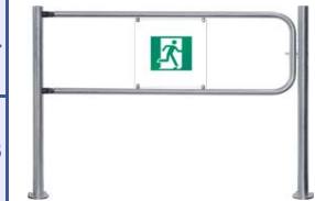
Поворотная секция ограждения серии PERCo-BH02 со стопорным механизмом