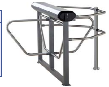
Электронная проходная PERCo-KR05.4