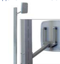
Стойка PERCo-BH03 и считыватель PERCo-IR10 с кронштейном