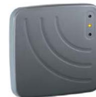
Считыватель дальнего действия PERCo-IR10