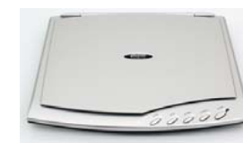
Сканеры Plustek OpticSlim 500+ Plustek OpticSlim 550