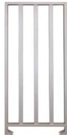
Секция полноростового ограждения серии PERCo-MB-15