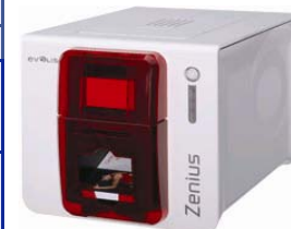
Принтер Evolis Zenius USB