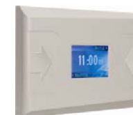
Контроллер регистрации PERCo-CR01