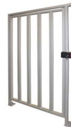
Полноростовая калитка PERCo-WHD-15R

ПРИМЕЧАНИЕ: Под заказ возможна окраска калиток без привода PERCo-WHD-15 в другие цвета по каталогу RAL. Срок изготовления и стоимость оговариваются дополнительно.