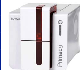
Принтер Evolis Primacy, USB & Ethernet