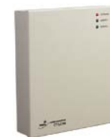
Контроллер замка/турникета PERCo-CT/L04