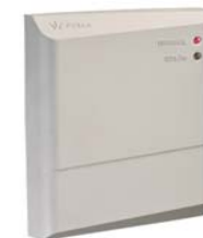
Контроллер управления доступом PERCo-SC-820