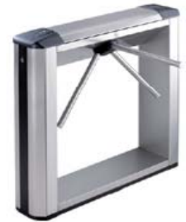
Электронная проходная PERCo-KT05.4 в комплекте со стандартными планками