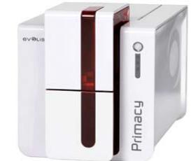
Принтер Evolis Primacy, USB & Ethernet