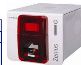
Принтер Evolis Zenius USB