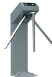
Турникет-трипод с планками Антипаника PERCo-TTR-04.1G