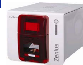
Принтер Evolis Zenius USB