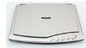
Сканеры Plustek OpticSlim 500+ Plustek OpticSlim 550