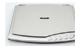
Сканеры Plustek OpticSlim 500+ Plustek OpticSlim 550