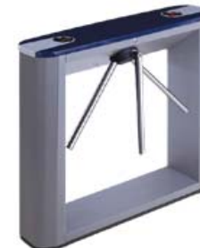
Тумбовый турникет-трипод с планками Антипаника PERCo-TTD-03.1G