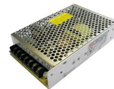
Блок питания NES-150-24