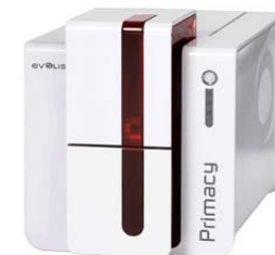
Принтер Evolis Primacy, USB & Ethernet