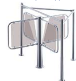
Турникет PERCo-RTD-03S с формирователем PERCo-RB-03S