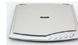
Сканеры Plustek OpticSlim 500+ Plustek OpticSlim 550