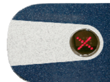
Крышка турникета с индикатором PERCo-C-03G blue