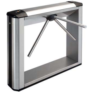
Электронная проходная PERCo-KTC01.4 в комплекте со стандартными планками