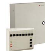
Прибор приемно-контрольный охранно-пожарный PERCo-PU01