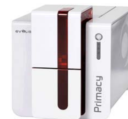
Принтер Evolis Primacy, USB & Ethernet