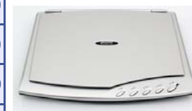
Сканеры Plustek OpticSlim 500+ Plustek OpticSlim 550